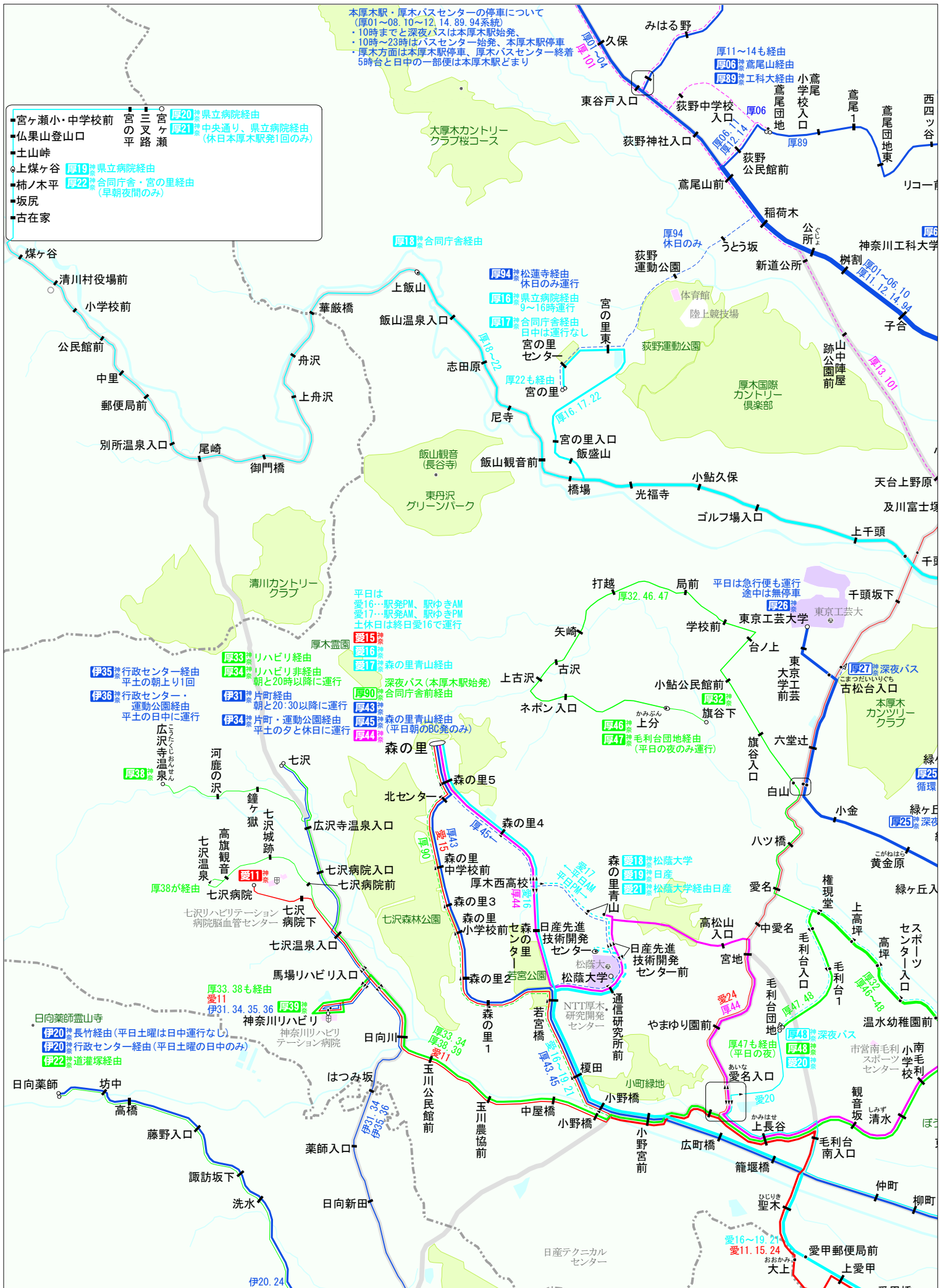
Bus Service Map 線の太さは、平日の運行回数を意味します。 <運行間隔の目安> 150回以上(高頻度) 25~49回(20~45分間隔) 100~149回(5~10分間隔) 10~24回(少ない) 50~99回(10~20分間隔) 1~9回(非常に少ない)